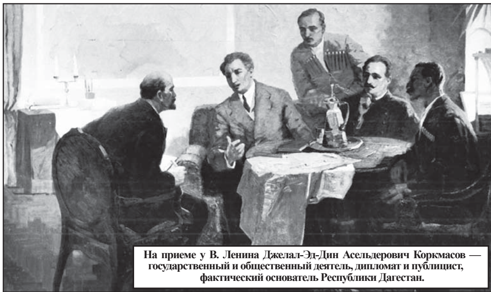
На приеме у В. Ленина Джелал-Эд-Дин Асельдерович Коркмасов — государственный и общественный деятель, дипломат и публицист, фактический основатель Республики Дагестан.

20 января 2026 г. исполнилось 105 лет со Дня законодательного оформления Дагестана в составе Российской Советской Федеративной Социалистической Республики. Весьма интересна предыстория принятия столь значимого для горских народов этого исторического решения.